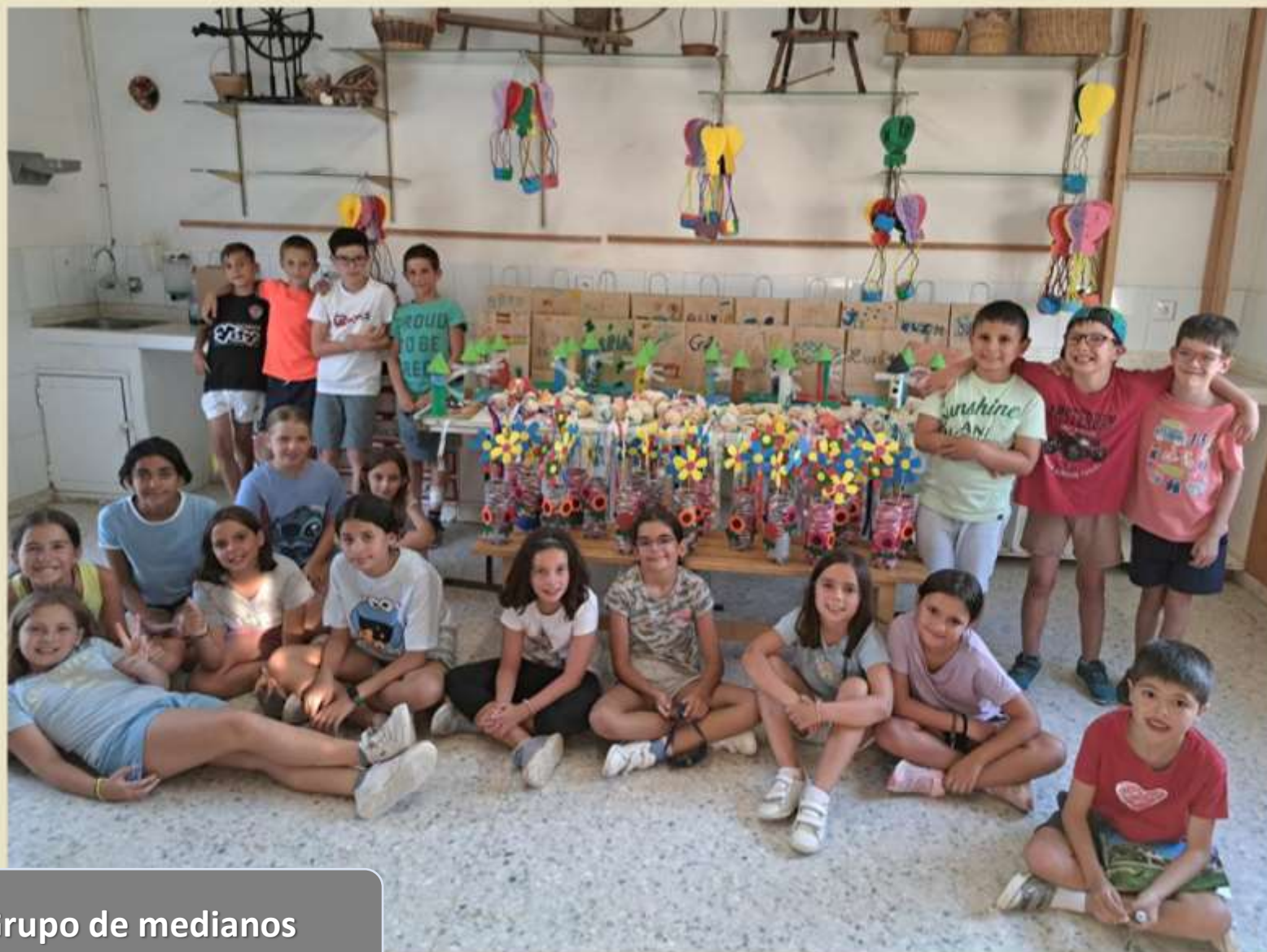
Grupo de medianos